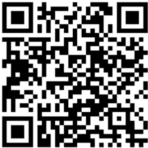
Young Person's Guide to the Frankfurt Radio Big Band

Insofern empfehle ich vorab einen Überblick über die typischen Instrumente der Bigband und ggf. auch des Sinfonieorchesters. Dazu eignet sich unsere Video-Reihe »Young Person's Guide«, die der Hessische Rundfunk sowohl für die hr-Bigband, wie auch für das hr-Sinfonieorchester produziert hat. In leicht verständlichen und kurzen Clips werden hier die einzelnen Instrumente von unseren Musiker*innen beleuchtet, sodass einerseits eine Basis für das jeweilige Instrument geschaffen wird und andererseits auch etwas Insiderwissen vermittelt wird.