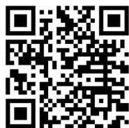
Facebook-Kanal der hr-Bigband

Weitere Informationen und klingendes Material finden Sie auch auf den Kanälen der hr-Bigband: