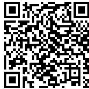
Young Person's Guide to the Frankfurt Radio Symphony

Die unten angefügten Materialblätter beinhalten die Links via QR-Code zu den einzelnen Instrumenten.